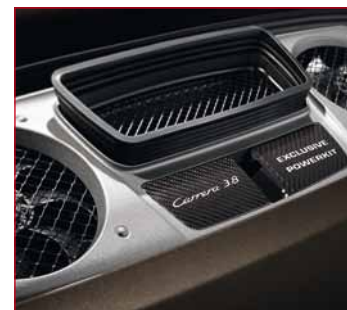
Die Porsche 911 Carrera S Leistungssteigerung: noch mehr Dynamik, noch mehr Performance.

pelendrohren in eigenständigem Design 2 gehören zum Leistungssteigerungspaket dazu. Optisches Erkennungszeichen ist das veränderte Motorraumstyling mit titanfarbener Abdeckung und Einlegern in Carbon. Leistungssteigerung muss eben nicht immer „nur“ mit Zahlen zu tun haben. Und wer noch mehr Individualität für seinen Porsche möchte – dessen Wünsche lassen sich mit Porsche Exclusive und Tequipment ebenfalls erfüllen. Da wäre zum Beispiel das AeroKit Cup mit zusätzlichem starrem Heckflügel über dem Heckspoiler und spezieller Spoiler-Lippe vorn mit weiteren Lufteinlässen – um nur eine der vielen Möglichkeiten zu nennen.