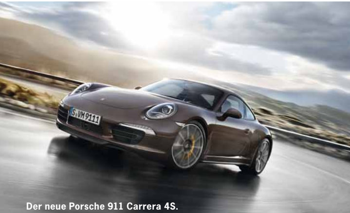
Der neue Porsche 911 Carrera 4S.