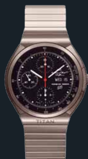
Titanium Chronograph von 1980