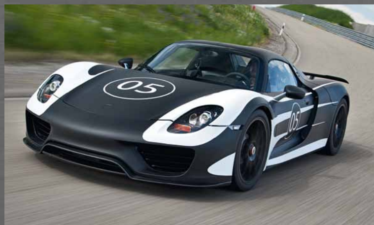
Der 918 Spyder ist auf der Straße: Mit den Prototypen, deren Tarnung historische Porsche 917 Rennfahrzeuge zitiert, beginnt die finale Abstimmung des 918 Spyder.