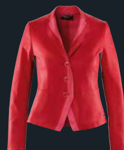
RawTec Blazer von 2011